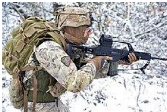
Ranger del battaglione alpini paracadutisti "Monte Cervino" con HK G36, durante una sessione di addestramento congiunto in Germania del 2015