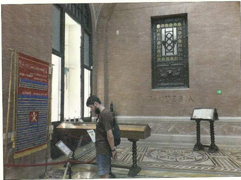
Riflessioni davanti al Medagliere.

La Mostra, intitolata “Cent’anni, Cento scatti”, era composta di 100 immagini fotografiche di dimensioni 75 x 50, fissate su